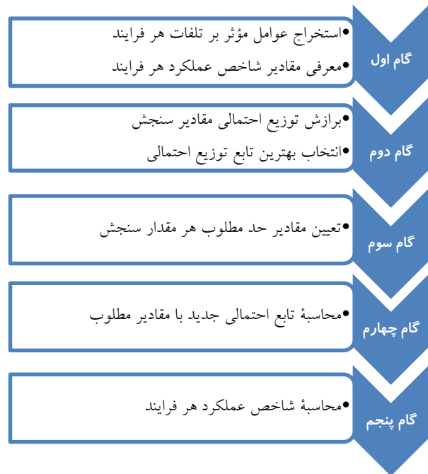
شکل (۲): الگوریتم روش پیشنهادی

که در آن، n_i تعداد تجهیز نام که با مشخصات طراحی شده فرق می‌کند