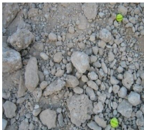
شکل (۲): نمونه‌ای از تصاویر گرفته شده برای کالیبره کردن نرم افزار

که در آن، F نیروی فید (کیلونیوتن)، n سرعت چرخش (دور بر دقیقه)، \sigma مقاومت فشاری توده سنگ (مگاپاسکال)، d قطر چال (سانتی متر) و N نرخ نفوذ (متر بر دقیقه) است؛ بنابراین در این تحقیق، با توجه به دستگاه حفاری ROC D7 فرض بر این است که سختی