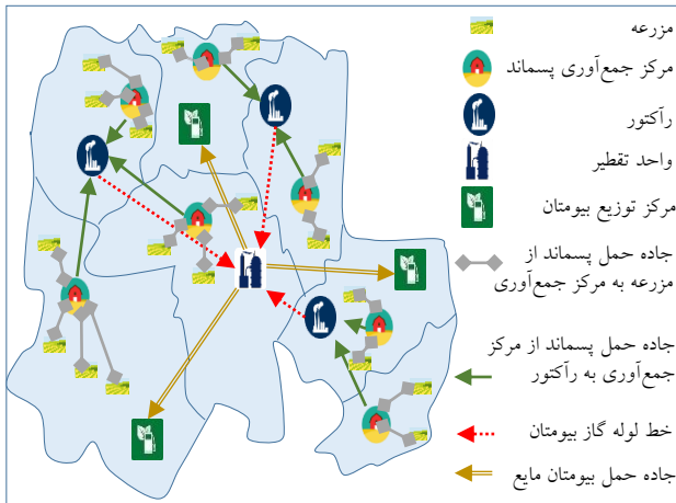
شکل (۱): مدل ترسیمی زنجیره تأمین چهار مرحله ای بیومتان

تأمین به مرحله بعدی ارسال می کنند، به نحوی تعیین می شود که مجموع هزینه های زنجیره تأمین بیومتان حداقل گردد. محدودیت های میزان تقاضای راکتور به هر نوع پسماند در مقابل میزان عرضه آن، در دسترس بودن نیروی کار و ضایعات پسماند در این مدل در نظر گرفته شده اند.